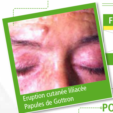
Eruption cutanée lilacée Papules de Gottron